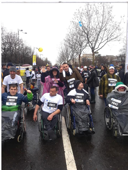
Bucharest Running Club Locul 3 în concurs la Categoriea Disability -Fotolii rulante

(Convenția cu privire la Drepturile Copilului, art. 23, paragraful 1)